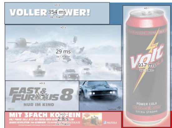
Zeit bis zum 1. Kontakt